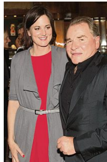
Fritz Wepper mit Frau Susanne Kellermann