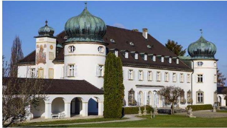
Ein beliebter Ort, um Hochzeiten zu feiern: Schloss Höhenried am Starnberger See